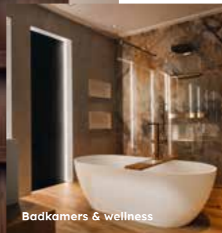
Badkamers & wellness